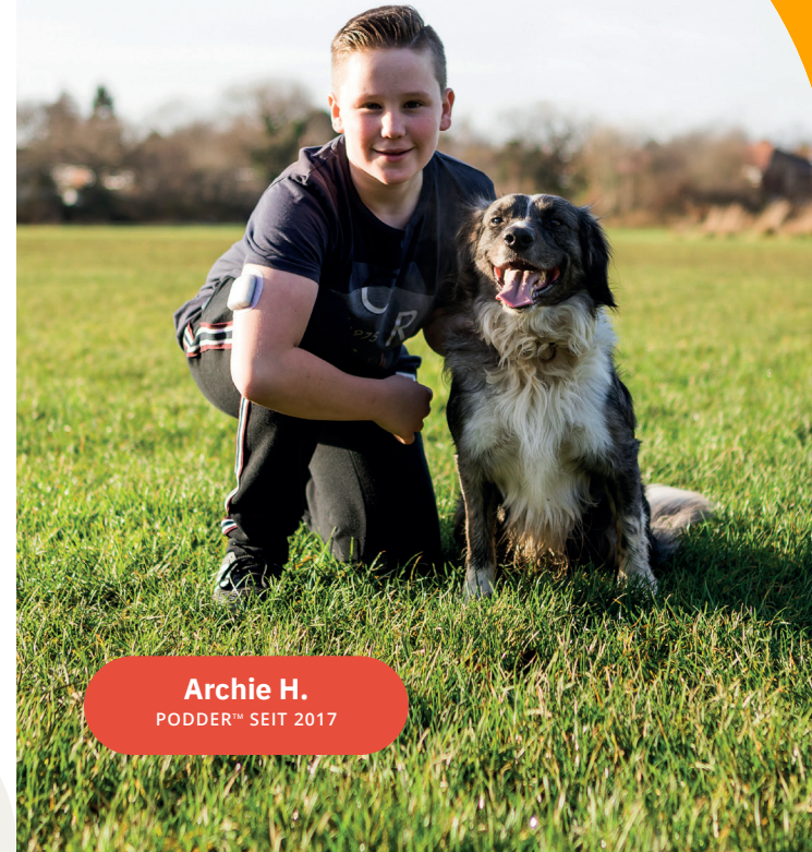
Archie H. PODDER™ SEIT 2017